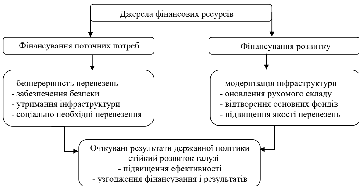
Рис. 2. Схема фінансування залізничного транспорту

З метою узагальнення джерел і каналів руху фінансових ресурсів у залізничній галузі сформовано схему фінансування залізничного транспорту, що відображає поєднання бюджетних, позабюджетних і залучених ресурсів (рис. 2).