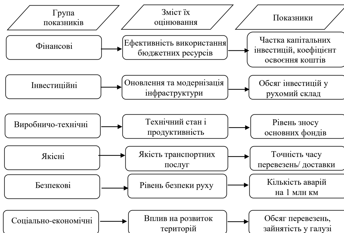
Рис. 4. Система показників оцінювання результативності фінансового механізму державного управління (логіка «цілі – результати»)

Запропонована система показників результативності (рис. 4) структурована за такими групами: фінансові, інвестиційні, виробничо-технічні, якісні та соціально-економічні. Такий підхід забезпечує перехід від контролю за використанням ресурсів до управління результатами розвитку галузі.