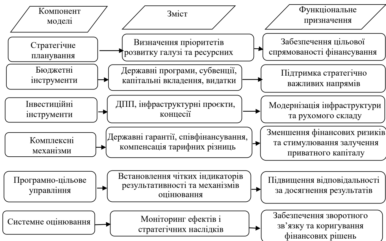
Рис. 5. Модель удосконаленого фінансового механізму державного управління розвитком підприємств залізничного транспорту

управління розвитком підприємств залізничного транспорту, яка поєднує стратегічне планування, бюджетні інструменти, інвестиційну диверсифікацію, компенсаційні механізми та систему оцінювання результативності.