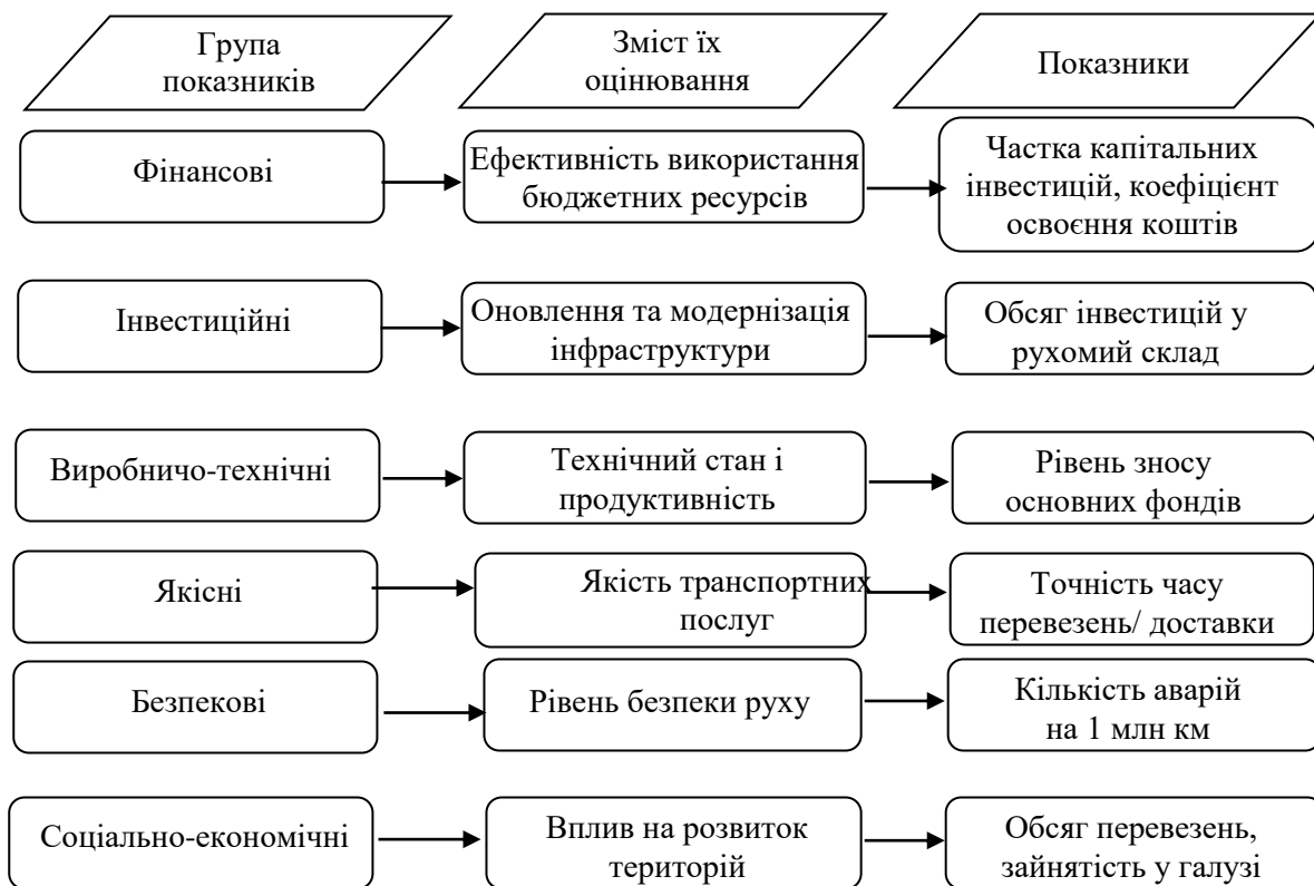
Рис. 4 – Система показників оцінювання результативності фінансового механізму державного управління (логіка «цілі – результати»)

Запропонована система показників результативності (рис. 4) структурована за такими групами: фінансові, інвестиційні, виробничо-технічні, якісні та соціально-економічні. Такий підхід забезпечує перехід від контролю за використанням ресурсів до управління результатами розвитку галузі.