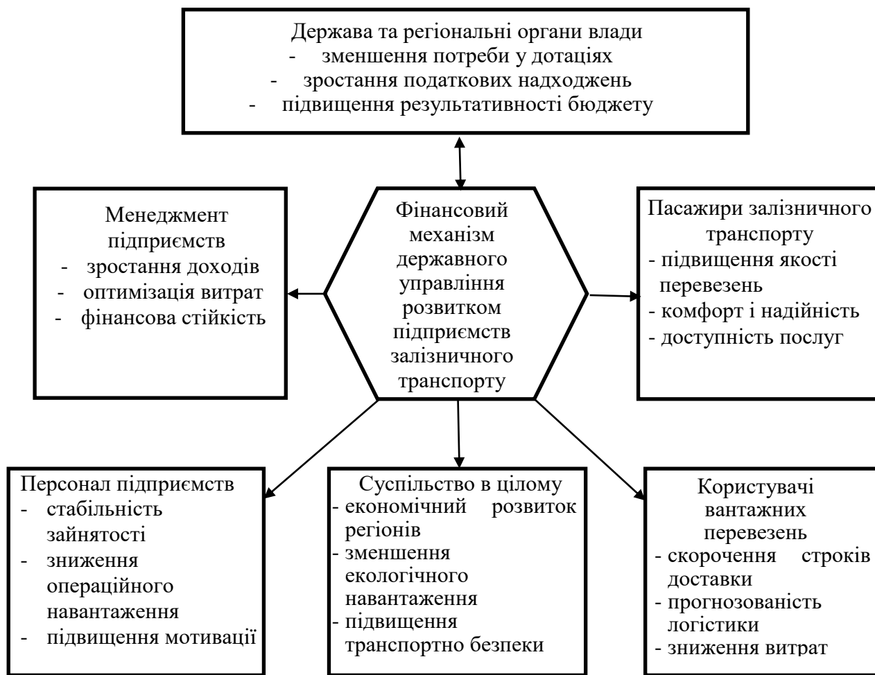
Рис. 3. Основні ефекти фін. механізму розвитку залізничного транспорту

Визначено стейкхолдерів удосконалення фінансового механізму та узагальнено його ефекти (рис. 3)